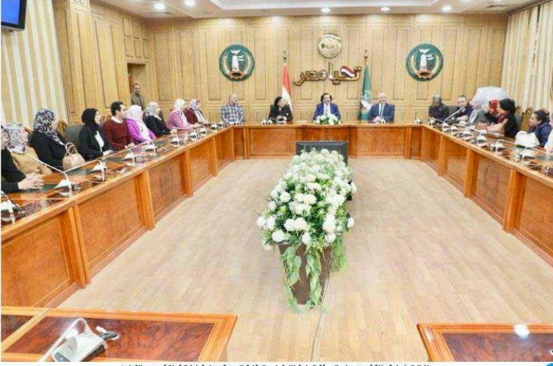
محافظ المنوفية يناقش مع وفد الهيئة العامة للاعتماد والرقابة الصحية سبل تعزيز الشراكة ودعم التعاون