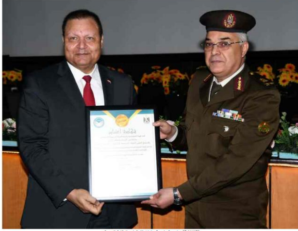
GAHAR) مراسم تسليم شهادات الاعتماد والرقابة الصحية