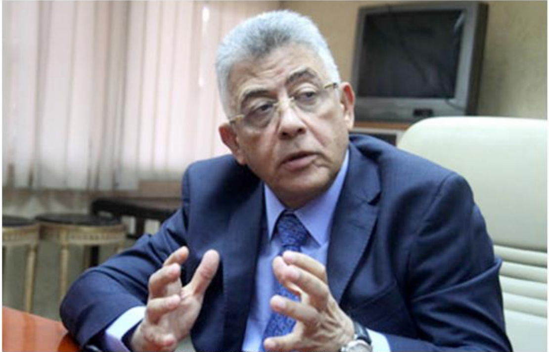
الدكتور أشرف إسماعيل، رئيس الهيئة العامة للاعتماد والرقابة الصحية

https://gate.ahram.org.eg/News/2809196.aspx