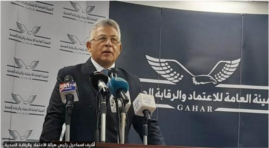
أشرف اسماعيل رئيس هيئة الاعتماد والرقابة الصحية