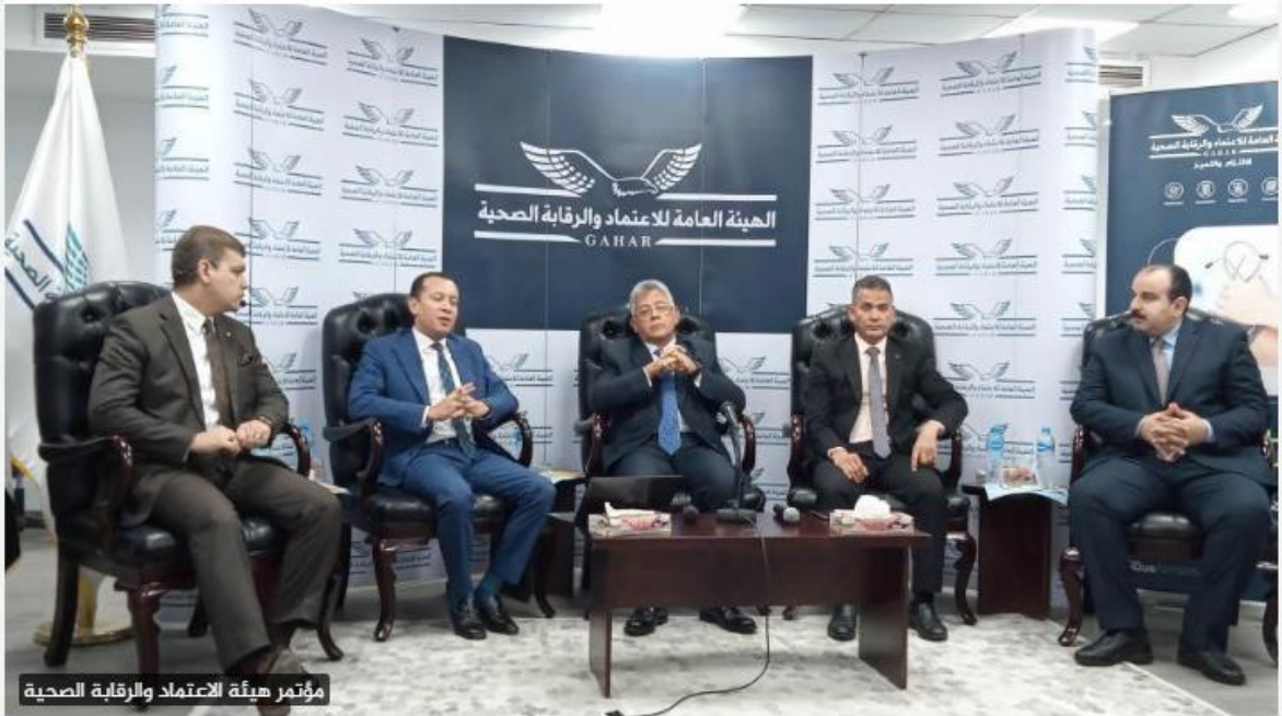
مؤتمر هيئة الاعتماد والرقابة الصحية