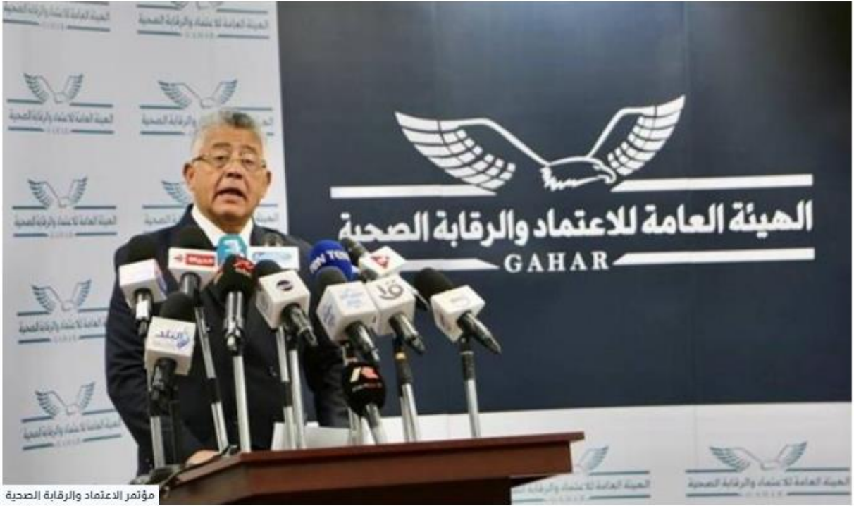
مؤتمر الاعتماد والرقابة الصحية