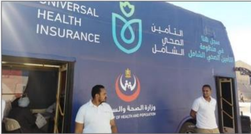
التأمين الصحي الشامل