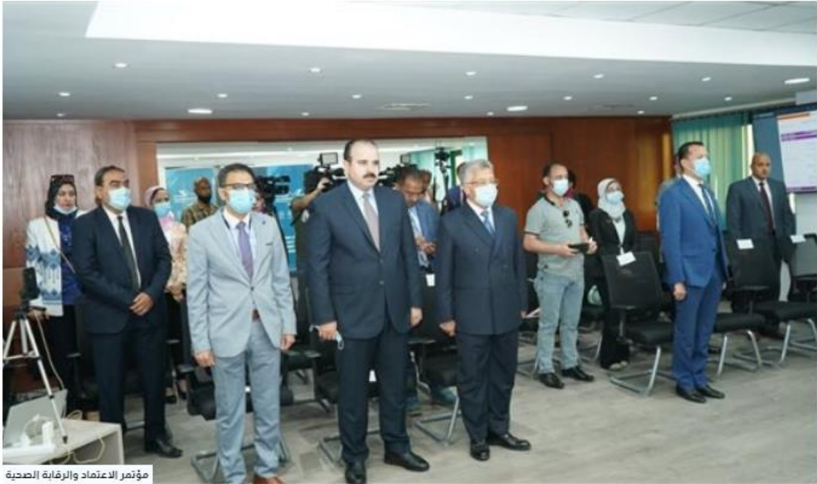
مؤتمر الاعتماد والرقابة الصحية