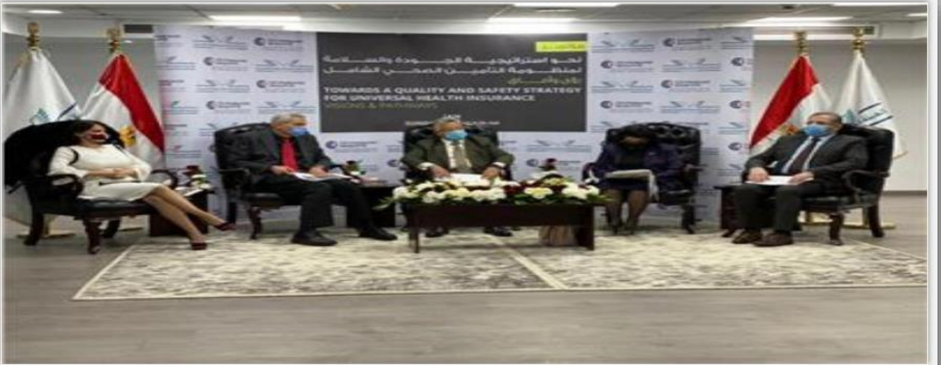
جانب من الجلسة

الصحة العالمية: كورونا أثبتت أن كل النظم الصحية بحاجة إلى خطط لإدارة الطوارئ