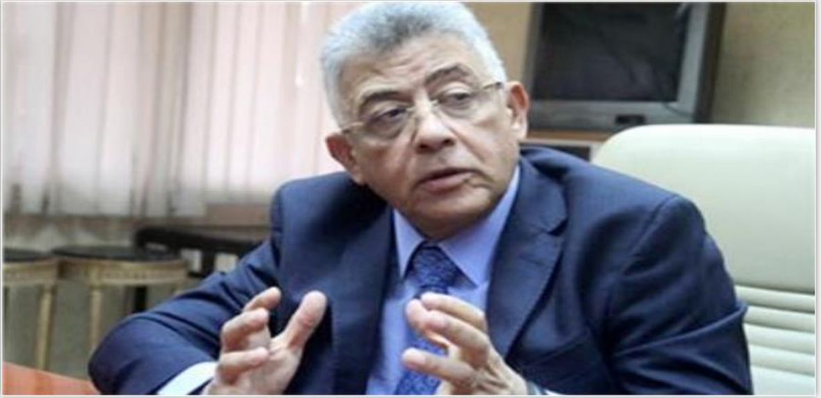
رئيس الهيئة العامة للاعتماد والرقابة الصحية

مصر تحصل على الاعتماد الدولي لمعايير المستشفيات