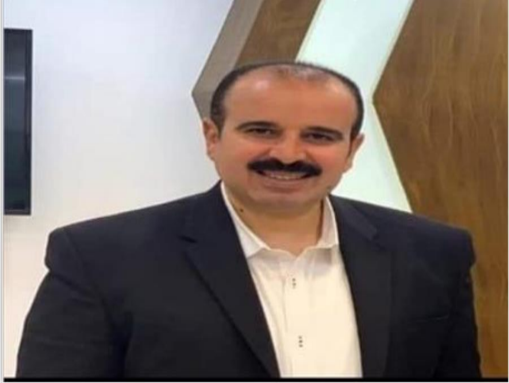
حسام أبو ساطي

«حسام أبو ساطي» مديراً تنفيذياً لهيئة الاعتماد والرقابة الصحية