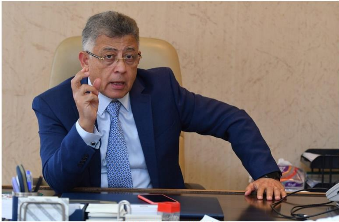
الدكتور اشرف اسماعيل رئيس هيئة الاعتماد والرقابة الصحية

http://gate.ahram.org.eg/News/2606440.aspx