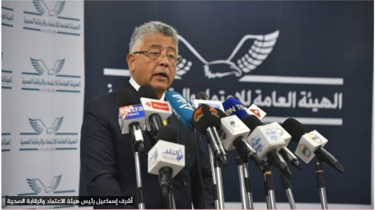
أشرف إسماعيل رئيس هيئة الاعتماد والرقابة الصحية