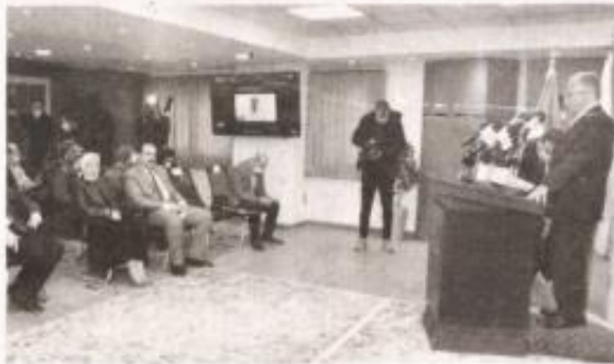
رئيس هيئة الاعتماد والرقابة الصحية خلال المؤتمر الصحفي أمس

الدليل الخاص بمعايير اعتماد الجمعية الدولية لجودة الرعاية الصحية للصيديات والمراكز الخاصة بالعلاج الطبيعي والعيادات، مشيراً إلى حصول كل من معايير اعتماد المستشفيات، ومعايير اعتماد مراكز الرعاية الأولية، الصادرين عن الهيئة عام ٢٠٢١، على اعتماد الجمعية الدولية لجودة الرعاية الصحية «الإسكوا» وذلك بنسبة نجاح بلغت ٩٨٪ لكل منهما، مؤكداً أن للمستشفيات ومراكز الرعاية الأولية التي ستقوم بتطبيق هذه المعايير ستتمكن من تقديم خدمات صحية ترقى إلى مثيلاتها العالمية.