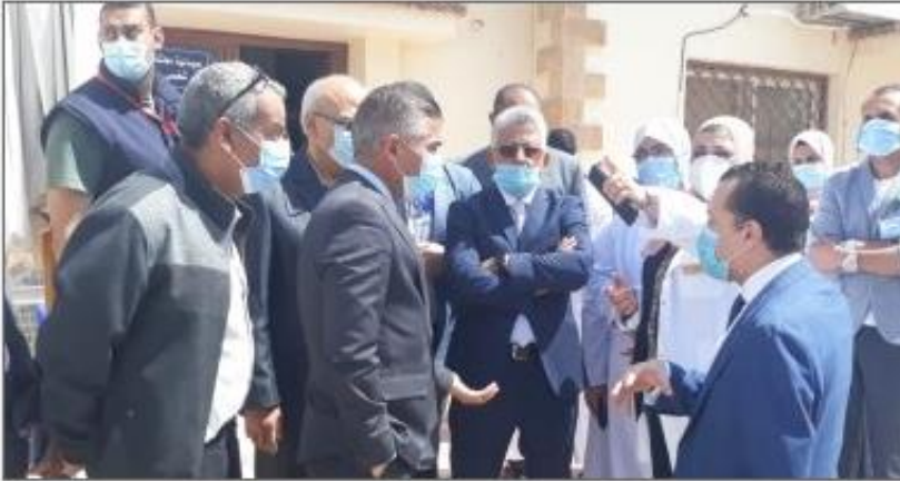
الرقابة الصحية تنفذ مستشفى هيئة قناة السويس