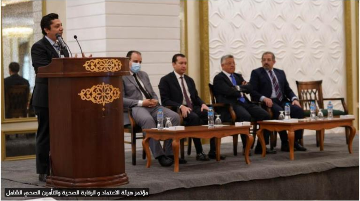
مؤتمر هيئة الاعتماد والرقابة الصحية والتأمين الصحي الشامل