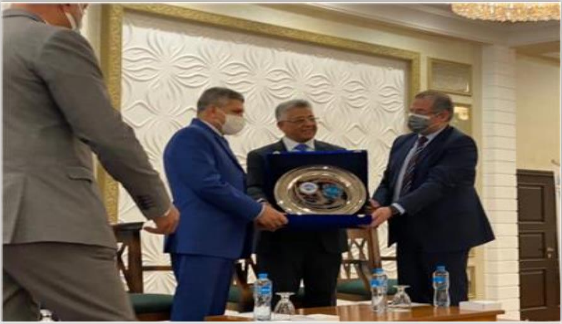
جانب من التكريم

الفريق أسامة ربيع: وزارة الصحة تقوم بخدمات كبيرة لرعاية صحة المصريين