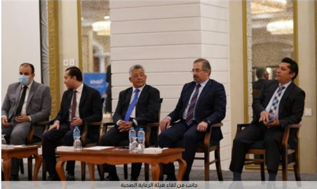
جانب من لقاء هيئة الرعاية الصحية