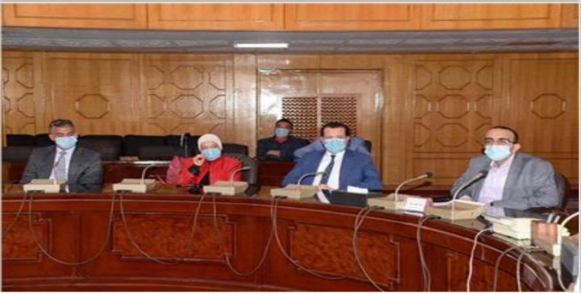
محافظ الإسماعيلية يستقبل مجلس إدارة الهيئة العامة للإعتماد والرقابة

محافظ الإسماعيلية يستقبل مجلس إدارة الهيئة العامة للإعتماد والرقابة الصحية