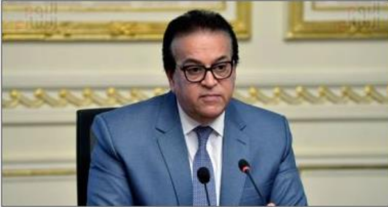
الدكتور خالد عبد الغفار وزير الصحة والسكان