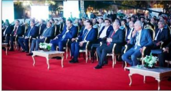
محاضرة الأخصر تستضيف فعاليات الملتقى السنوى الثالث للهيئة العامة للرعاية الصحية

عبدالفتاح السيسى حقق حلم المصريين فى الرعاية الصحية الشاملة والعادلة، من خلال إطلاق منظومة التأمين الصحى الشامل، لافتاً إلى تقديم 17 مليون خدمة طبية، و260 ألف عملية جراحية كبرى، ضمن المنظومة منذ انطلاقتها، مضيفاً أن 75% من المنشآت الطبية التابعة للهيئة مسجلة ومعتمدة من قبل هيئة الاعتماد والرقابة الصحية، وجرى اعتماد باقى المنشآت تباهاً.